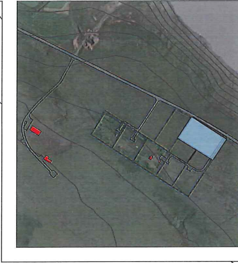
Yfirlitsmynd - ekki í kvörðu