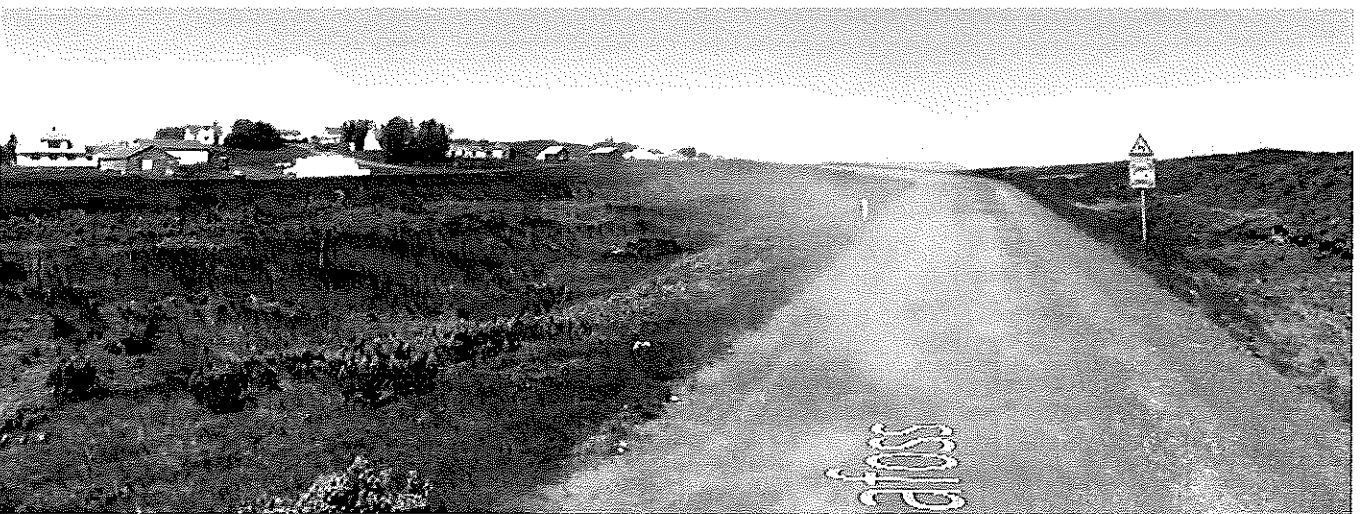
Mynd 7 Horft í norðurátt frá stöð 4900