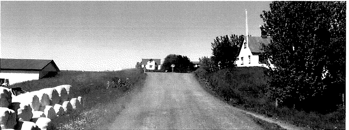
Mynd 6 Horft til norðurs úr stöð 4600. Egilsstaðir til hægri