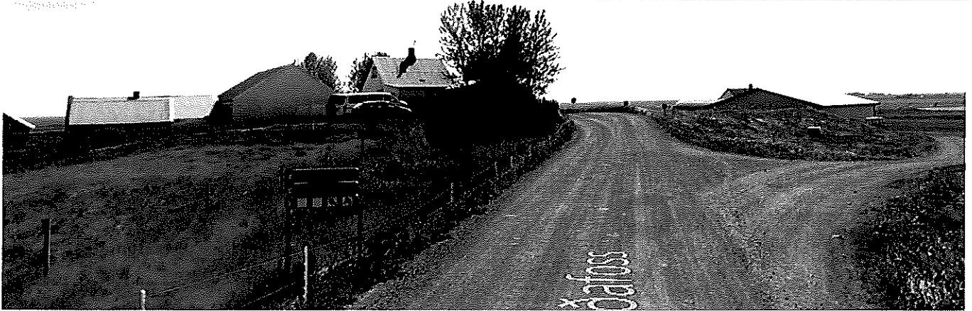
Mynd 5 Horft til suðurs úr stöð 4460. Egilsstaðir til vinstri