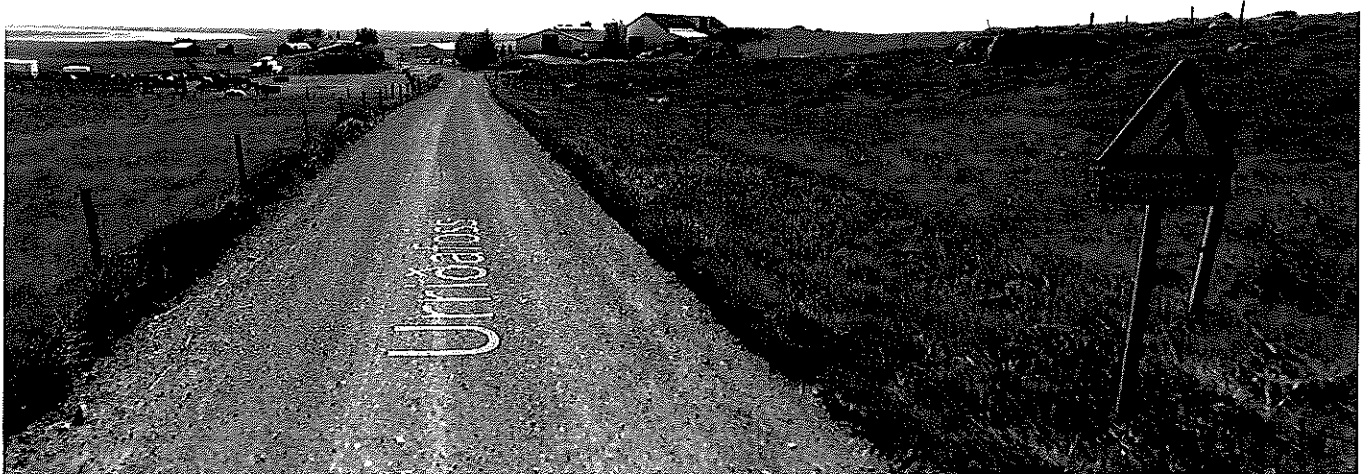
Mynd 3 Horft til suðurs heim að Egilsstaðakoti úr stöð 4240