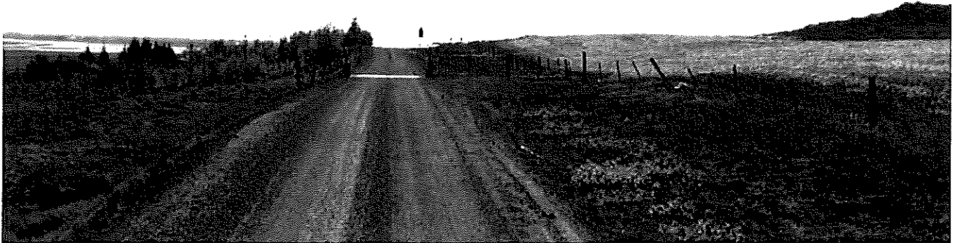
Mynd 2 Horft til suðurs úr stöð 4000. Ristarhliðið framundan er í stöð ca. 4040. Skiltastæðan á myndinn er í stöð 4100