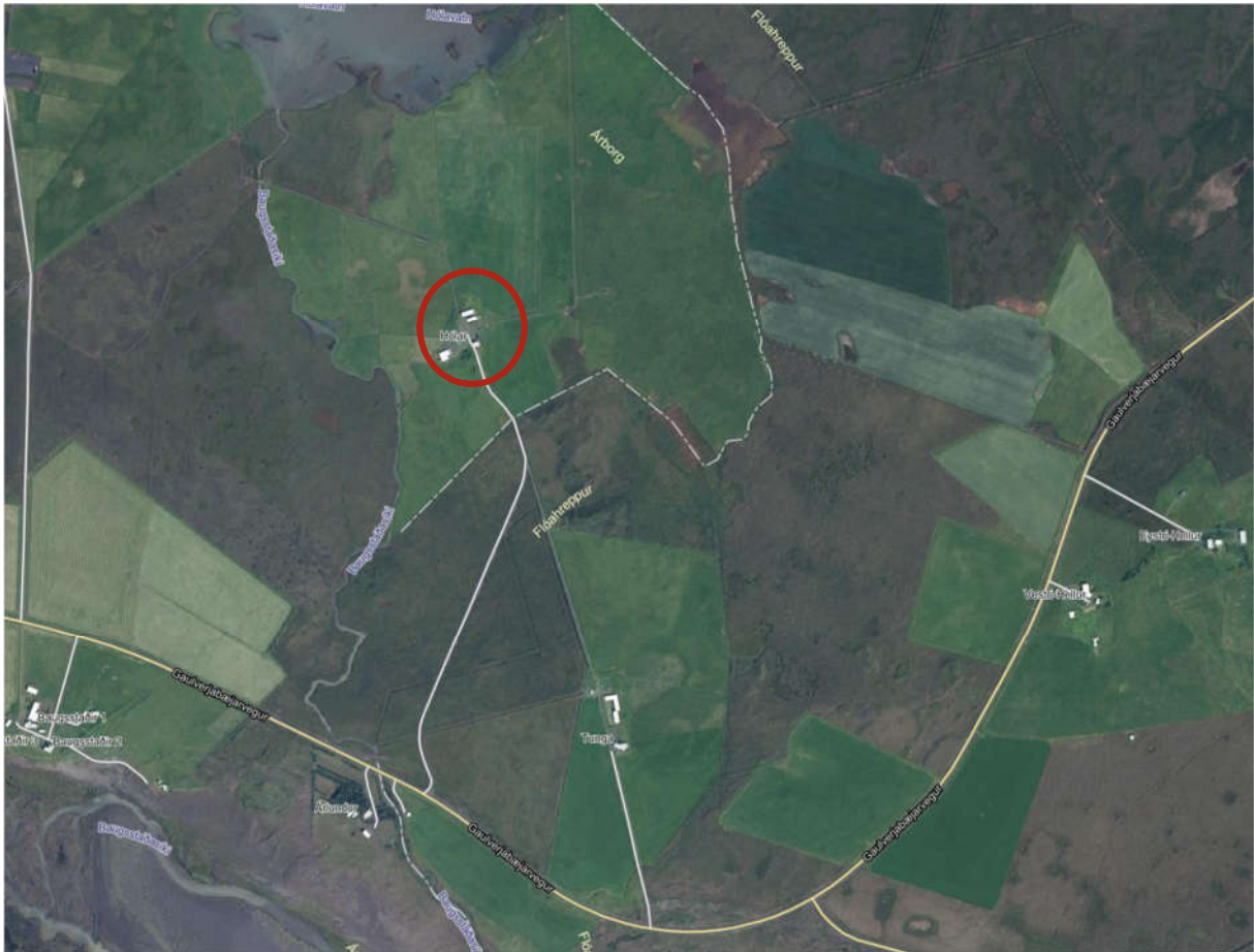
MYND 1. Yfirlitsmynd, svæðið er afmarkað með rauðum hring.