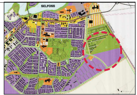
Aðalskipulag Árborgar 2010-2030