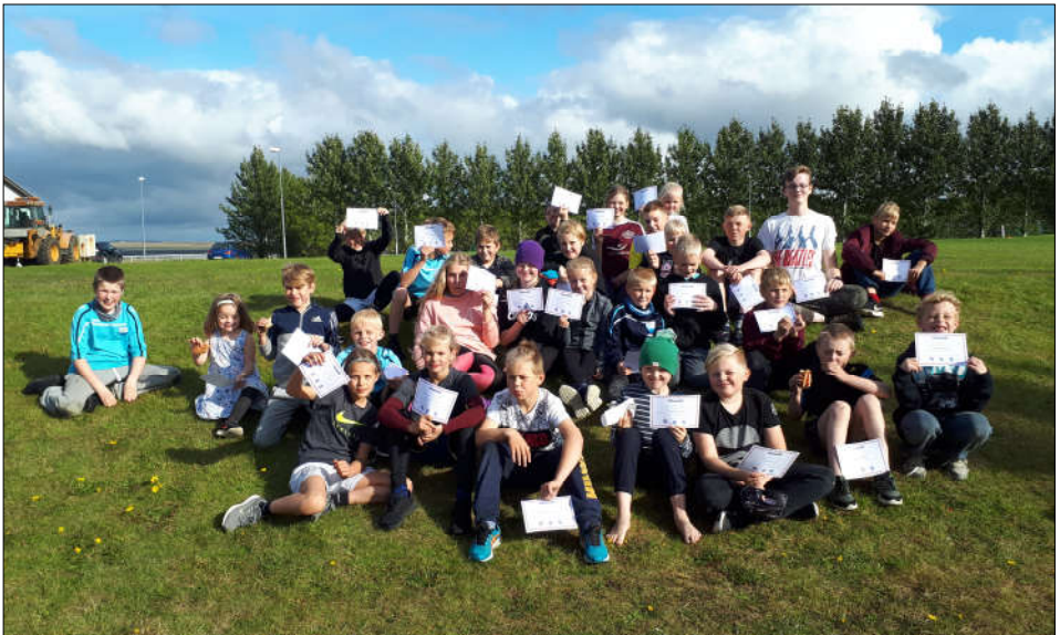
Hressir krakkar að loknu Flóamóti 2019