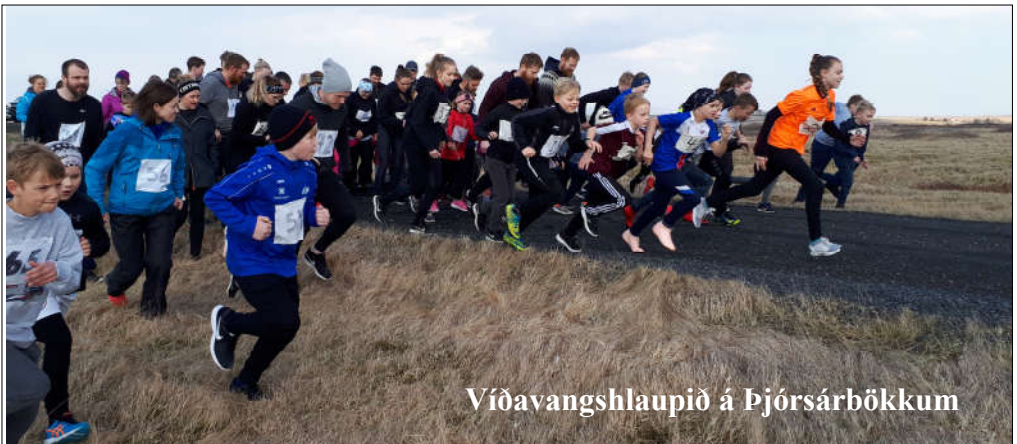
Víðavangshlaupið á Þjórsárbökkum