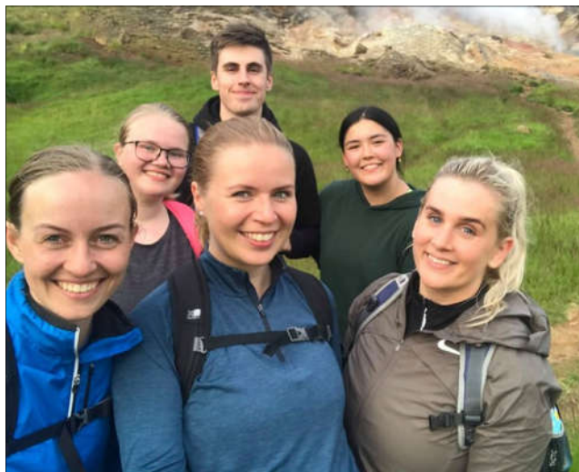
Þáttakendur í kvöldgöngu um Reykjadal 28. júlí

Sunna Skeggjádóttir Formaður skemmtinefndar