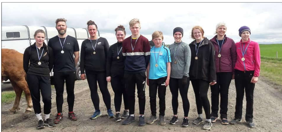
Keppendur í Brokk og skokk á Fjöri í Flóa