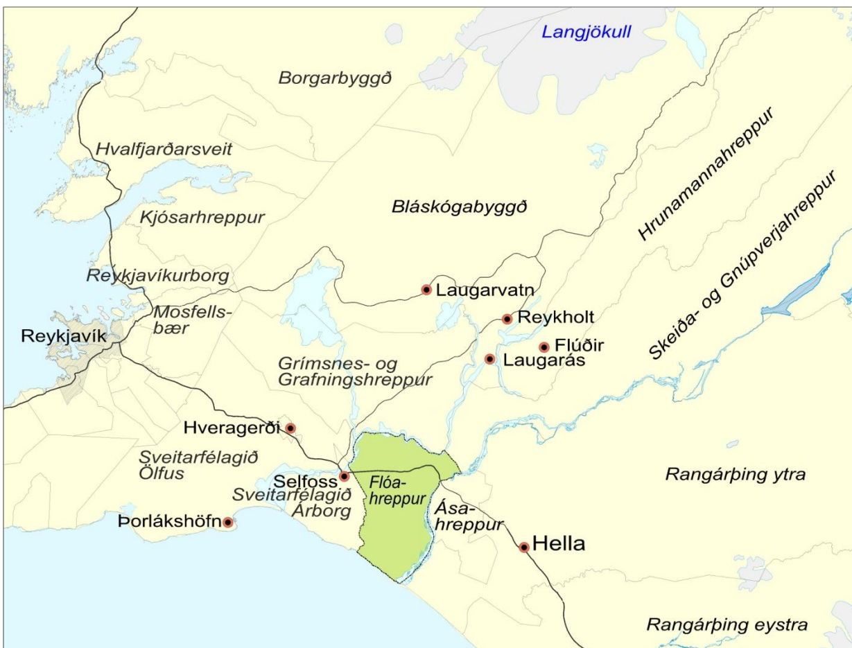
Mynd 1. Flóahreppur og aðliggjandi sveitarfélög.

Lýsing þessi er unnin í samræmi við skipulagslög nr. 123/2010 og lög um umhverfismat áætlana nr. 105/2006. Gerð er grein fyrir þeirri nálgun og þeim áherslum sem lagðar verða til í skipulagsvinnunni og hvernig staðið verður að samráði og kynningu á tillögunni. Vinna við stefnumörkun aðalskipulagsins hófst í ársbyrjun 2015.