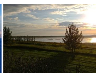
Þjórsárver - Tjaldsvæði