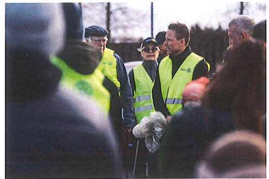
Höfundarréttur © 2025 Plokk / Rótary hreyfingin á Íslandi / Allur réttur áskilinn

Want to change how you receive these emails?