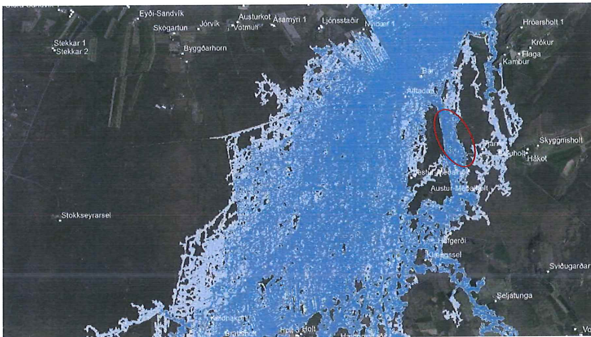
MYND 3. Útbreiðsla flóða í Ölfusá m.v. 100 (ljósblátt) og 200 (blátt) ára endurkomutíma. Skipulagssvæðið er innan rauða hringsins.

Fyrirhuguð íbúðarbyggð í Vestur-Meðalholti er á flóðasvæði vegna mögulegra flóða í Ölfusá, skv. skýrslu Veðurstofunnar um Hættumat vegna vatnsflóða í Ölfusá 1 . Flóðvatnið flæðir beggja vegna Gaulverjabæjarveggar. Í deiliskipulagi skal skoða nánar útbreiðslu og endurkomutíma flóða og setja gólfkóta m.v. flóðhæð.