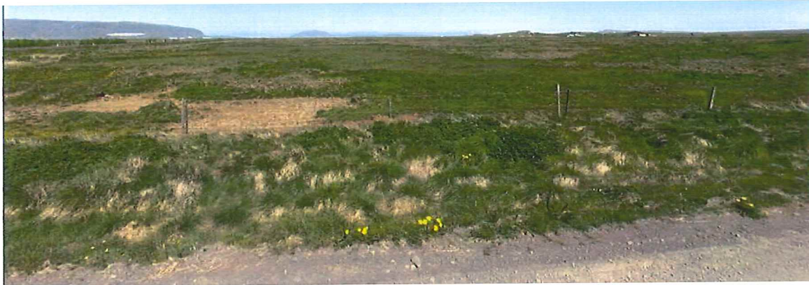
MYND 1. Horft norður yfir skipulagssvæðið.