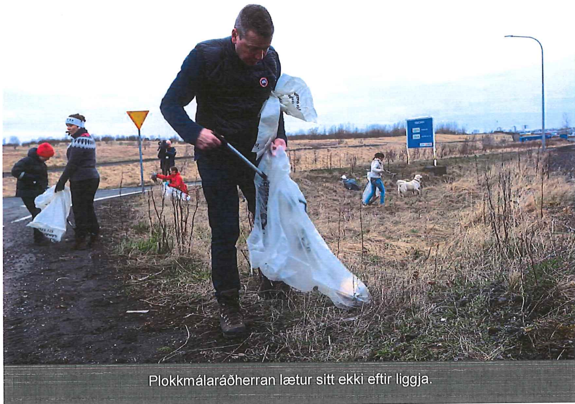
Plokkmálaráðherra lætur sitt ekki eftir liggja.